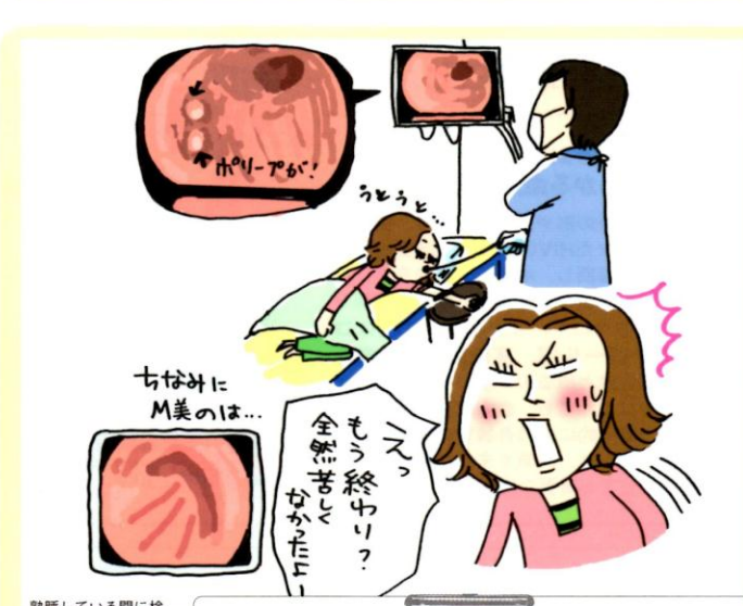
※実際はタオルをかけて検査をします。

前夜から自宅の下剤を服用し始め、検査までに大腸の中を空っぽにします。お尻の部分に穴の開いた検査着を着て、肛門からカメラが付いた細いチューブを挿入、大腸の内側を観察します。