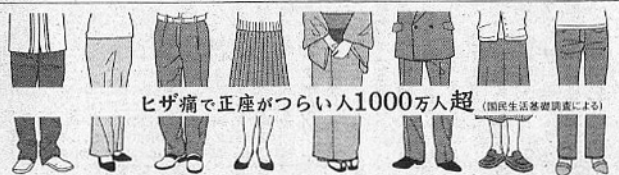
ヒザ痛で正座が辛い人1000万人超 (国民生活基礎調査による)

睡眠もとても重要で、男性は7時間半、女性は7時間の睡眠を意識することが健康かつ長寿のために必要。それから、毎日、30分は歩くこと。これにプラスして軽い運動を週に1〜2回行えば、健康維持に1つ効果的です。当たり前のようですが、食事、睡眠、運動を通して、自分の健康管理を自分で行うことが健康への第一歩だといえるでしょう。