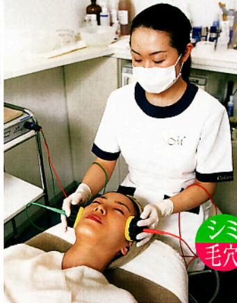
専用液が白濁するので、肌汚れが目に見えてわかる

「ショパール」を程 度、スベイン王室 御用薬ブランド「ロ ズ」の「エ」プレシ ン、コスメや美容介 する知識はプロ級