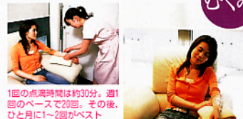
1回の点滅時間は約30分。週1回のペースで20回。その後、ひと月に1~2回がベスト

マキアビューティズNo.1として誇りを飾る。コスメや健康に詳しく、独自の美容法を編み出す見識も