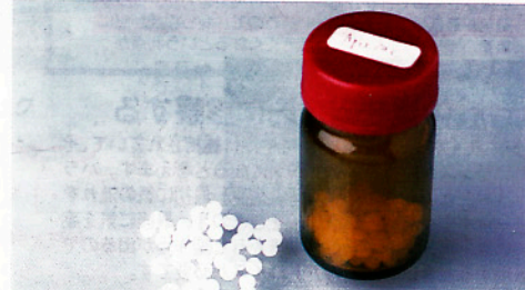
↑乳糖に成分を含ませたレメディ。含まれる成分は10の60乗から200万乗倍に薄められています。ほかに液状のレメディもあり